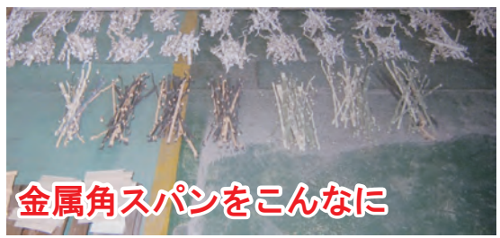
金属角スパンをこんなに